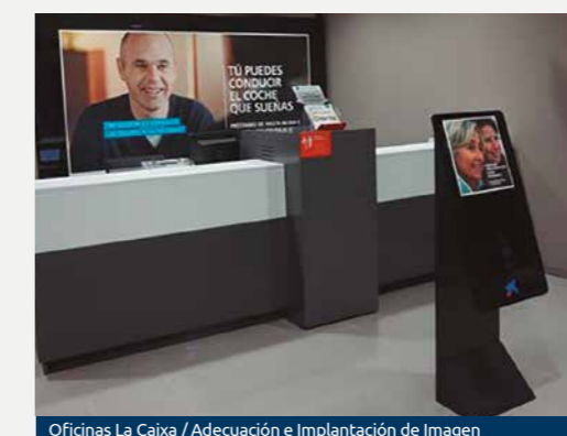
Oficinas La Caixa / Adecuación e implantación de Imagen